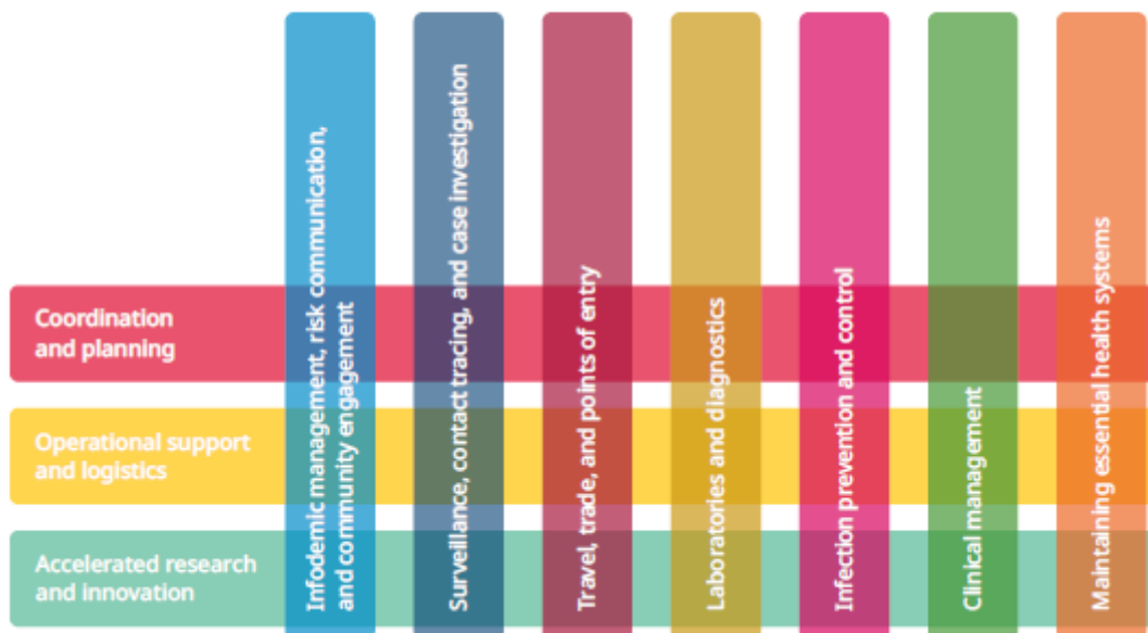
Figure 4 The pillars of WHO's response to COVID-19

Eine schöne Matrix für alle, horizontal die, die sich den Kuchen aufteilen: